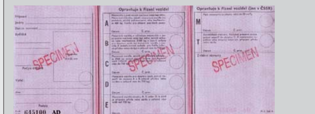
Řidičské průkazy vydané v roce 1964–1986 (platnost do 31. 12. 2007)

Vzhledem k velkému objemu řidičských průkazů (ŘP) určených k výměně je smyslem této informace dosažení stavu rovnoměrného tempa výměny ŘP a odstranění stresujících situací vyvolaných obrovským náporům zájemců o výměnu řidičských průkazů před koncem lhůt výměn jednotlivých typů řidičských průkazů. Tohoto stavu není možné dosáhnout bez aktivní spolupráce držitelů ŘP.